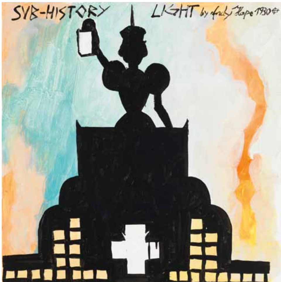
2 Sub-History Light , 2013 Lacquer and acrylic on canvas 60 × 60 cm

When Hope 1930 titled a recent painting Sub-History Light (2013) after the words inscribed across its top, he seems to have called both Hegel and Adorno to task. For not only does his conception of a kind of impenitently unserious under-history dispel the compulsive gravitas and crushing inevitability of Hegel’s historical spirit, but it also echoes and impugns the hierarchic, often patronizing, morality of Adorno’s aesthetic chiaroscuro. In ‘The Culture Industry: Enlightenment as Mass Deception’ (a chapter of Dialectic of Enlightenment , 1944) he and Max Horkheimer opined: ‘Light art has accompanied autonomous